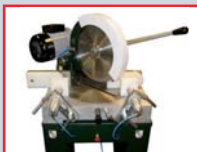
POSICIÓN DE DESCANSO PARA CORTE A 45° CON GIRO HACIA LA DERECHA.