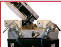
POSICIÓN DE DESCANSO PARA CORTE A 45° CON VUELCO HACIA LA IZQUIERDA.