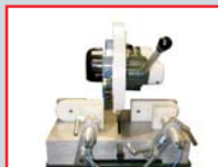
POSICIÓN DE DESCANSO PARA CORTE A 90° VERTICAL.