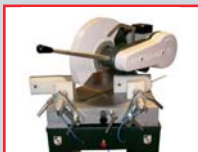
POSICIÓN DE DESCANSO PARA CORTE A 45° CON GIRO HACIA LA IZQUIERDA.